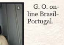
G. O. on-line Brasil-Portugal.