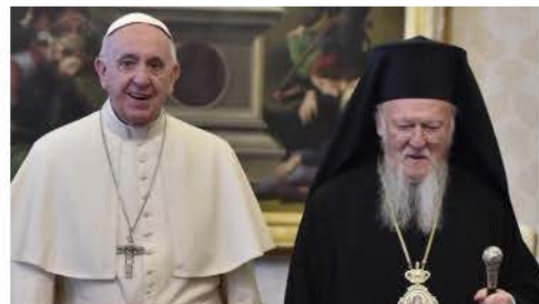
Sua Santidade Papa Francisco e Sua Santidade Patriarca Ecumênico Bartolomeu I