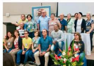
Segunda Comissão Organizadora da Associação AVVD e membros administrativos, 2016.