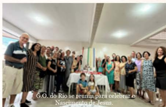
G.O. do Rio se reuniu para celebrar o Nascimento de Jesus.