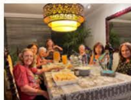
G. O. da Asa Sul de Brasília.