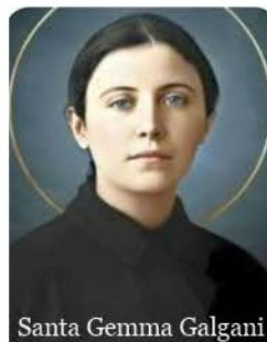
Santa Gemma Galgani

Presença divina. Aqui estão reunidas e representadas Madalena e Marta: uma contemplativa aos Pés do Senhor e a outra que trabalha para Ele. Assim se expressava Santa Gemma nesse estado: “Enquanto eu tinha muitos desejos, minha alma andava inquieta; agora que tenho só um, sou feliz. Mas já que o vosso amor é inacessível, deixai-me proceder como entendo, ó Jesus. Aqui em meu coração quero erguer-vos uma tenda toda de amor; só vós deveis entrar nela; eu vos prenderei junto a mim; sereis sempre meu prisioneiro, não vos restituirei mais a liberdade, não! até que me deis a consolação que eu tanto desejo. Que desejo eu, e que vos peço, ó Jesus? Vede que estamos de acordo; peço-vos o que vós mesmo quereis e desejo o que vós mesmo desejais” . Em seguida vem um mais perfeito grau de união mística, o Sono Místico , que provém do amor de Deus e faz a alma adormecer e repousar tranquilamente no seio de Deus, seu espírito fica perdido em Deus. O Senhor concedia esta graça a Gemma até muitas vezes ao dia. Logo depois se manifestou para ela o fenômeno da Embriaguez Espiritual , um grau ainda mais perfeito de mística entre todos até aqui.