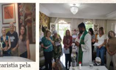
Celebração Eucarística, em Brasília, pela Unidade dos Cristãos.