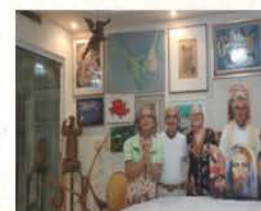
Celebração da Santa Eucaristia pela Unidade dos Cristãos, em Copacabana.