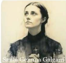
Santa Gemma Galgani

Santa Gemma teve uma vida curta. Nasceu em Camigliano, Toscana, em 12 de março de 1878, e cresceu em Lucca, Itália, onde faleceu em 11 de abril de 1903, em um Sábado Santo, aos 25 anos, por tuberculose. Recebeu os estigmas da Paixão de Nosso Senhor e após sua morte passou a ser venerada como a “Virgem de Lucca”. Foi beatificada em 1933 por Pio XI e canonizada por Pio XII em 1940. Dotada de grande beleza física e espiritual, simplicidade, pureza, zelo e ingenuidade, Gemma foi agraciada com muitos dons divinos e teve diversas experiências místicas, desde a referida estigmatização, participação em todos os suplícios de Jesus Crucificado (suor de sangue, flagelação, coroação de espinhos, chaga no ombro...), diversos êxtases na Presença de Nosso Senhor, de Sua Mãe Santíssima, seu Anjo da Guarda São Gabriel e de Nossa Senhora das Dores, opressões diabólicas, visão de seu Anjo e do Anjo de seu diretor espiritual.