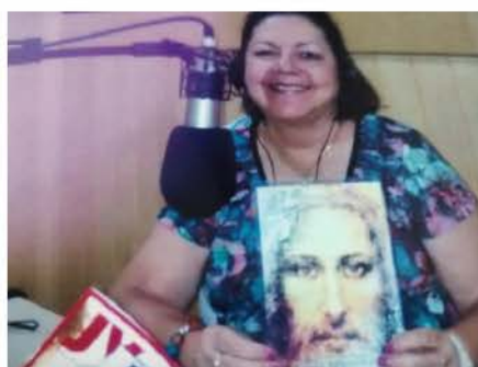
Evangelizando com o Hino de Amor, durante 20 anos, na Rádio Nova Aliança de Brasília.